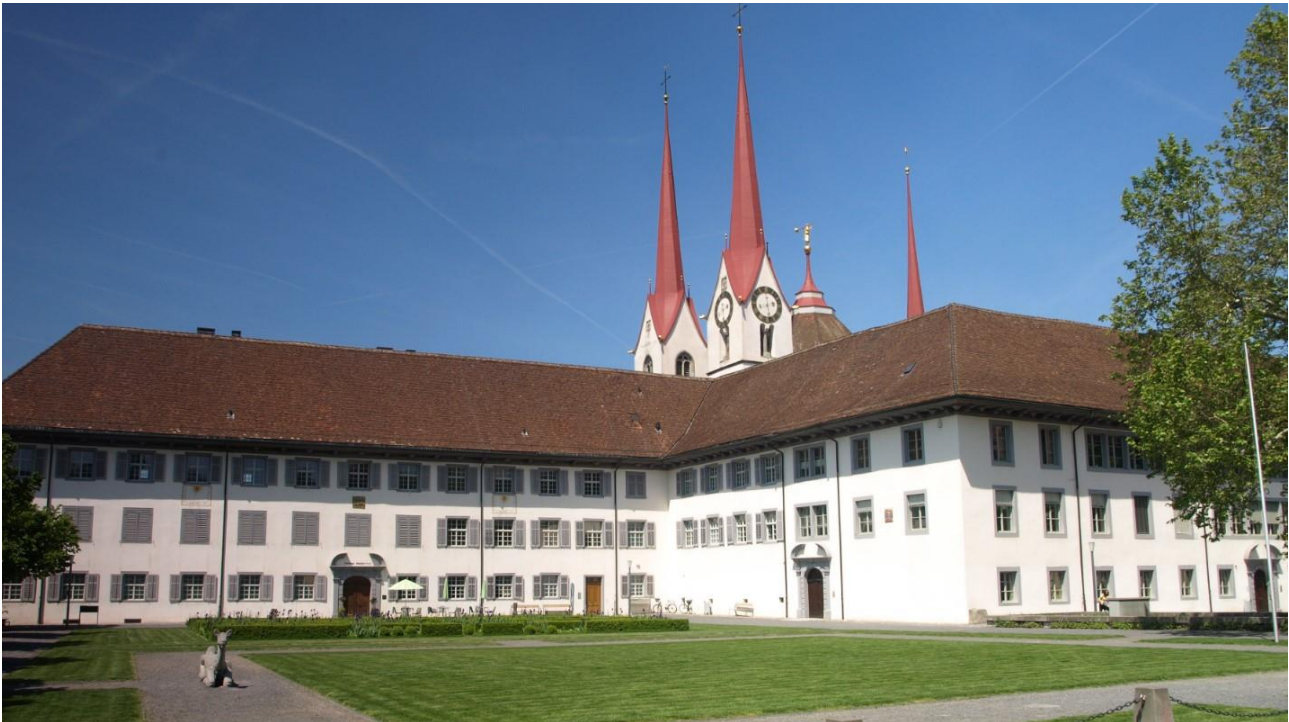
Le monastère de Muri