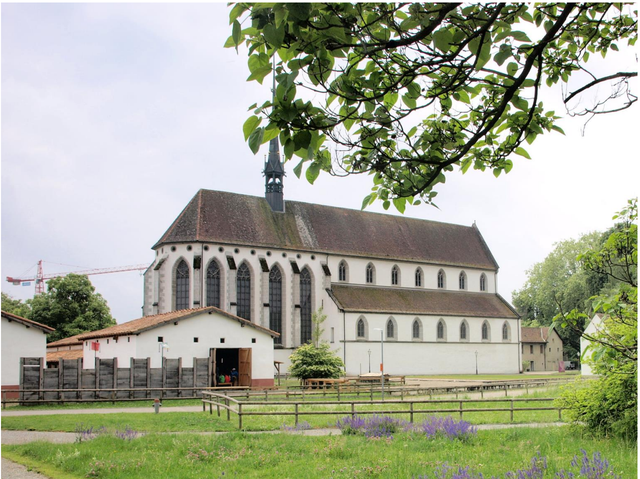
Couvent de Königsfelden

Rodolphe aurait souhaité voir son fils aîné Albert monter sur le trône, mais les électeurs, sans doute pour éviter de donner à la succession un caractère héréditaire qui affaiblirait leur propre pouvoir, ne l'entendirent pas ainsi. Précisons aussi que son fils Hartmann était mort par noyade, accidentellement, en 1281 aux environs de Rhinau et que son autre fils, Rodolphe II, duc d'Autriche et de Styrie, est décédé en 1290. Les électeurs accordèrent leur préférence à Adolphe de Nassau (1292) mais son comportement et son incompétence conduiront à sa destitution par une diète, convoquée pour l'occasion à Mayence en 1298, et à son remplacement par Albert. Les partisans de l'un et de l'autre vont s'affronter dans un combat farouche à Göllheim, entre Worms et Spire, au cours duquel Adolphe succomba (2 juillet 1298). Ils se retrouveront, mais un peu plus tard, inhumés côte à côte dans la cathédrale de Spire.